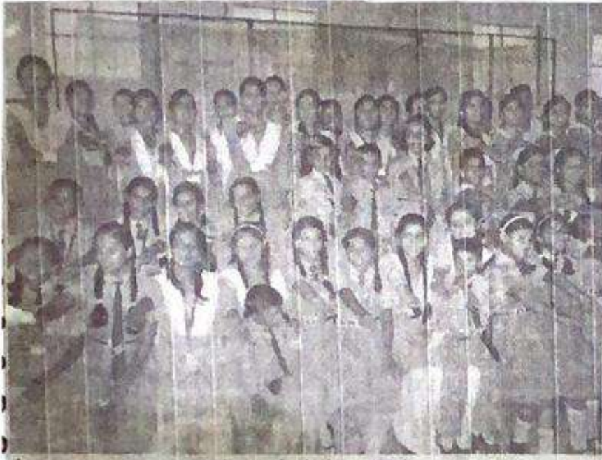
महाविद्यालय में चुने हुये छात्र प्रतिनिधि