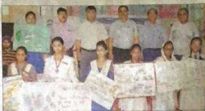
साकेत गर्ल्स कॉलेज में आयोजित जल संरक्षण कार्यक्रम में सम्मानित छात्राएं